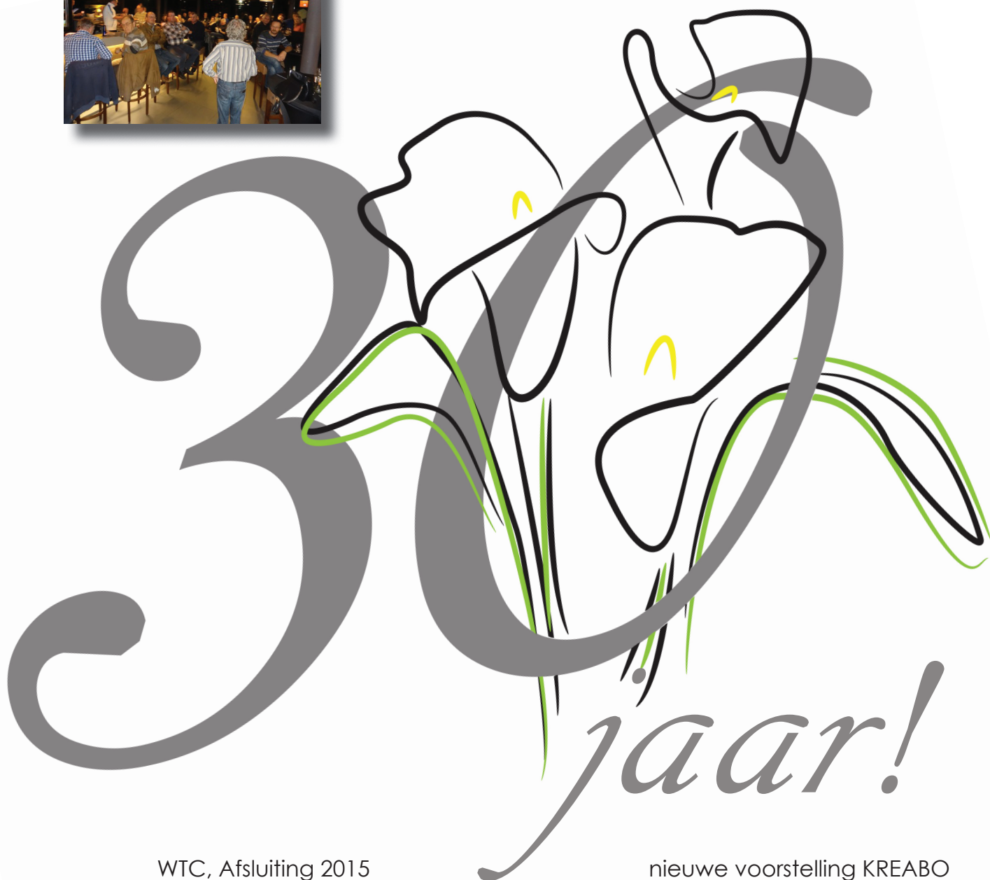
WTC, Afsluiting 2015