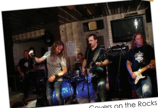
Covers on the Rocks