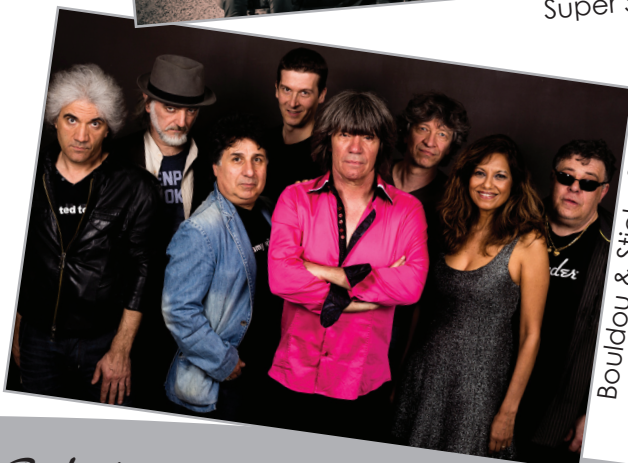
Bouldou & Sticky fingers